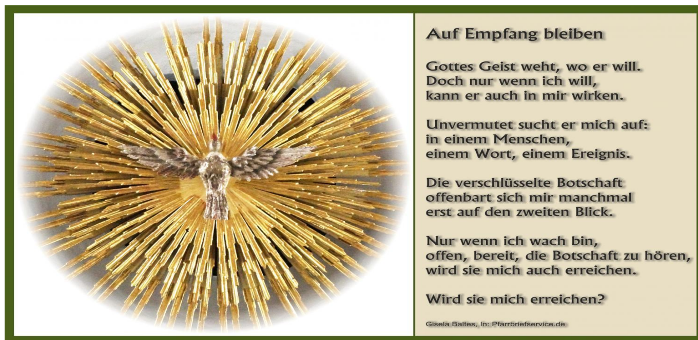
Bild: Martin Manigatterer (Bildkomposition), Gisela Balthes (Text) In: Pfarrbriefservice.de

Das Pfarrbüro in Holsten ist am Mittwoch, 29.05.24 geschlossen, Beiträge für den Pfarrbrief vom 01.06. – 08.06.04 können noch bis zum 27.05.24 per Mail oder im Briefkasten eingereicht werden.